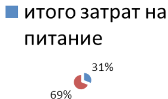
Рис. 1. Доля ежемесячных расходов на питание в семейном бюджете рабочих и служащих за период 1926 – 1929 гг. в среднем по СССР (%) [4, с. 59].